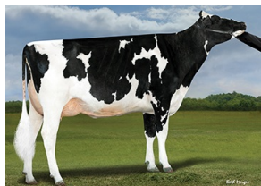
Pine-Tree 9839 Fraz 7613-ET