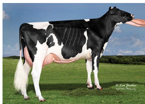
Kings-Ransom Fraz Daneen-ET