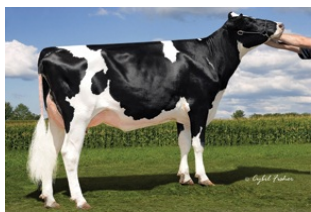
DAM Ms SSI Balst T 972-ET