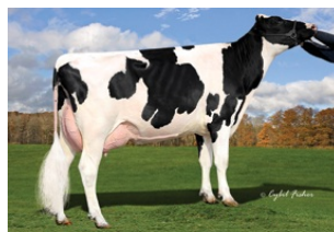
MGD Ms Welcome Uno Tarina-ET