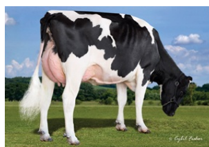
MGD S-S-I Supersire Miri 8679-ET