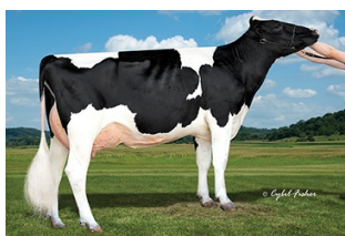
DAM S-S-I Unite 8679 10906-ET