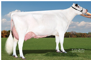
Jenny-Lou Rocketfire 4624