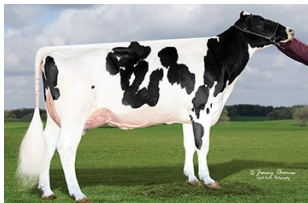
West Wing Rocketfire 2122-Grade