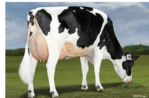
S-S-I Rocketfir 5033 8223-ET