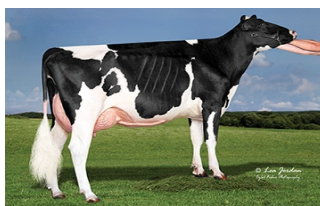
Kings-Ransom Fraz Daneen-ET