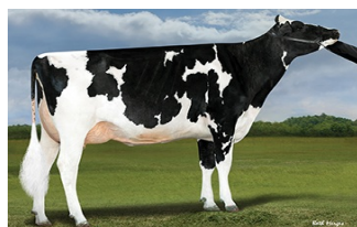
Pine-Tree 9839 Fraz 7613-ET