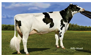
MGD Guided-Path Jedi Aruba