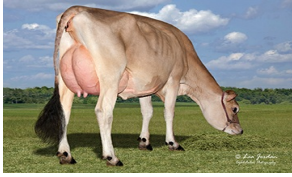
JX Victory 56609 Tucker 61765 {5}-ET